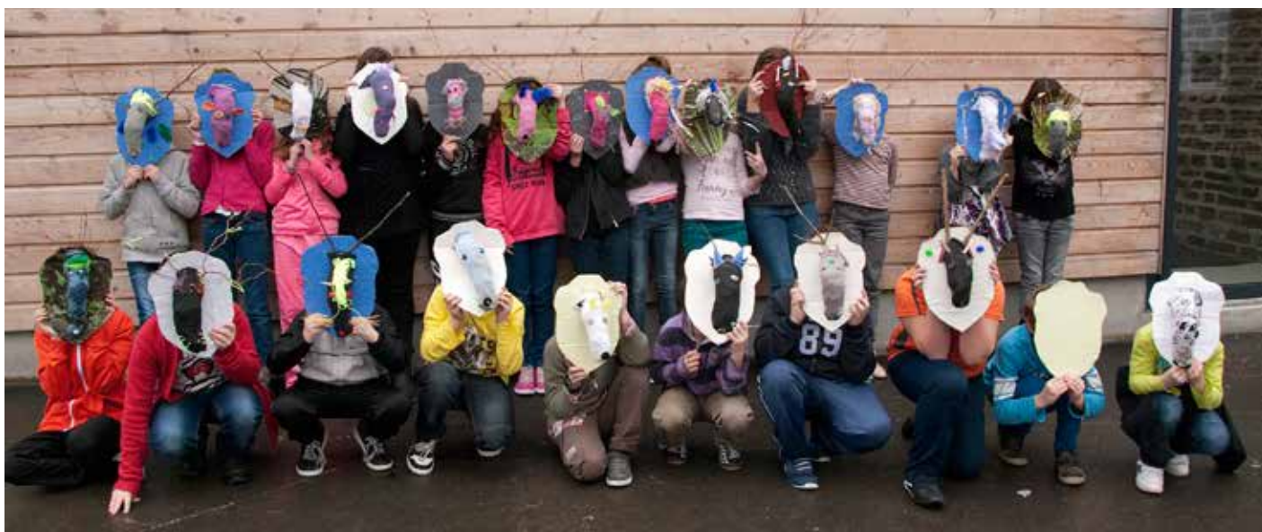
Trophées réalisés par les élèves de l'école primaire de St Rémy-sur-Orne dans le cadre d'un P.A.C. (projet artistique culturel). Thème : Le Bestiaire

A vous tous pour votre aide, votre participation et votre volonté de faire rayonner les campagnes de cultures artistiques.