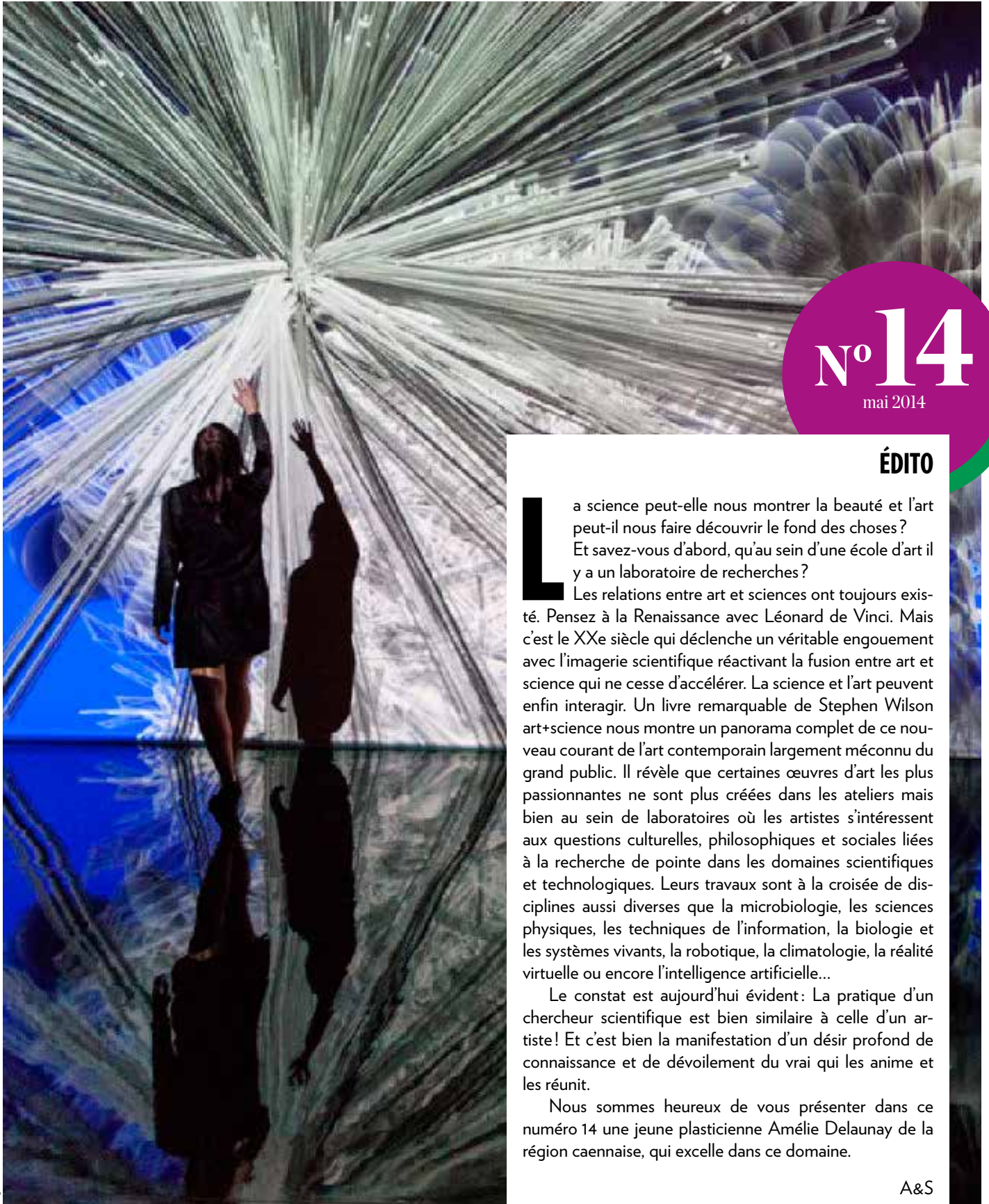
Miguel Chevalier, Fractal Flowers, 2014 - dr